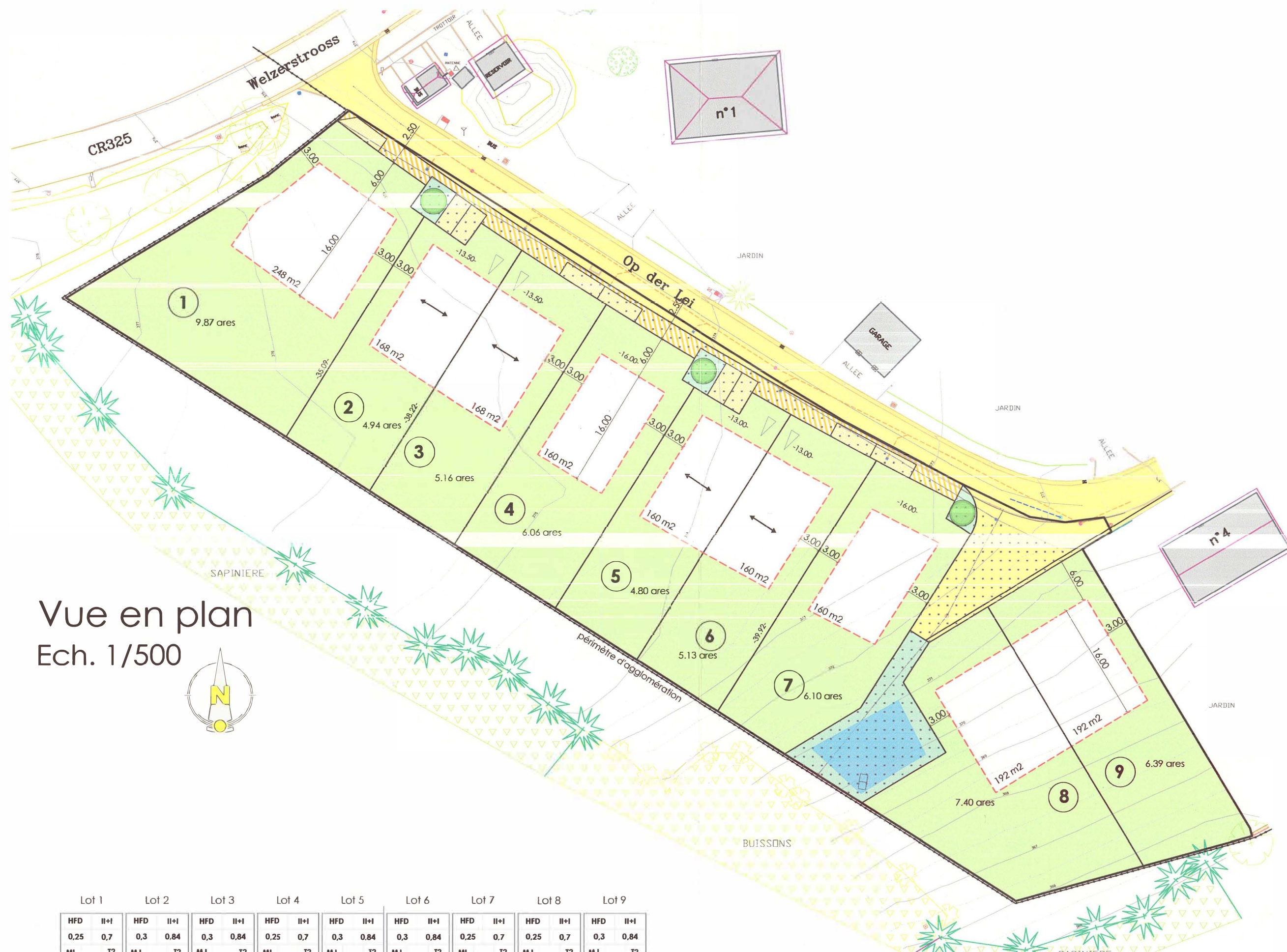
Vue en plan Ech. 1/500