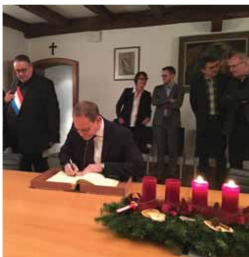
Michael MÜLLER, bourgmestre-gouverneur de Berlin