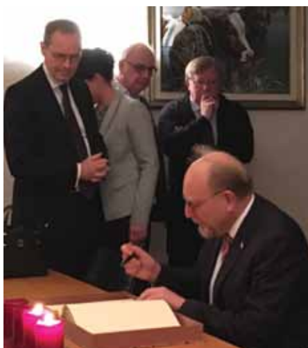
Heinrich KREFT, ambassadeur de la République fédérale d'Allemagne au Luxembourg