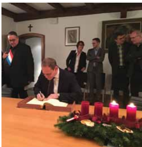
Michael MÜLLER, Oberbürgermeister von Berlin