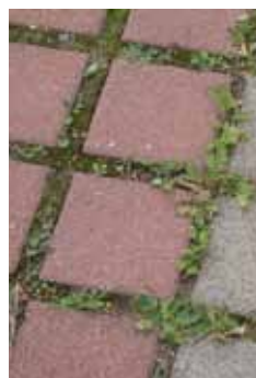
▲ Lutte thermique contre les mauvaises herbes.

Les revêtements perméables à l'eau et supportant la végétation permettront à différentes herbes de s'y établir. ▲