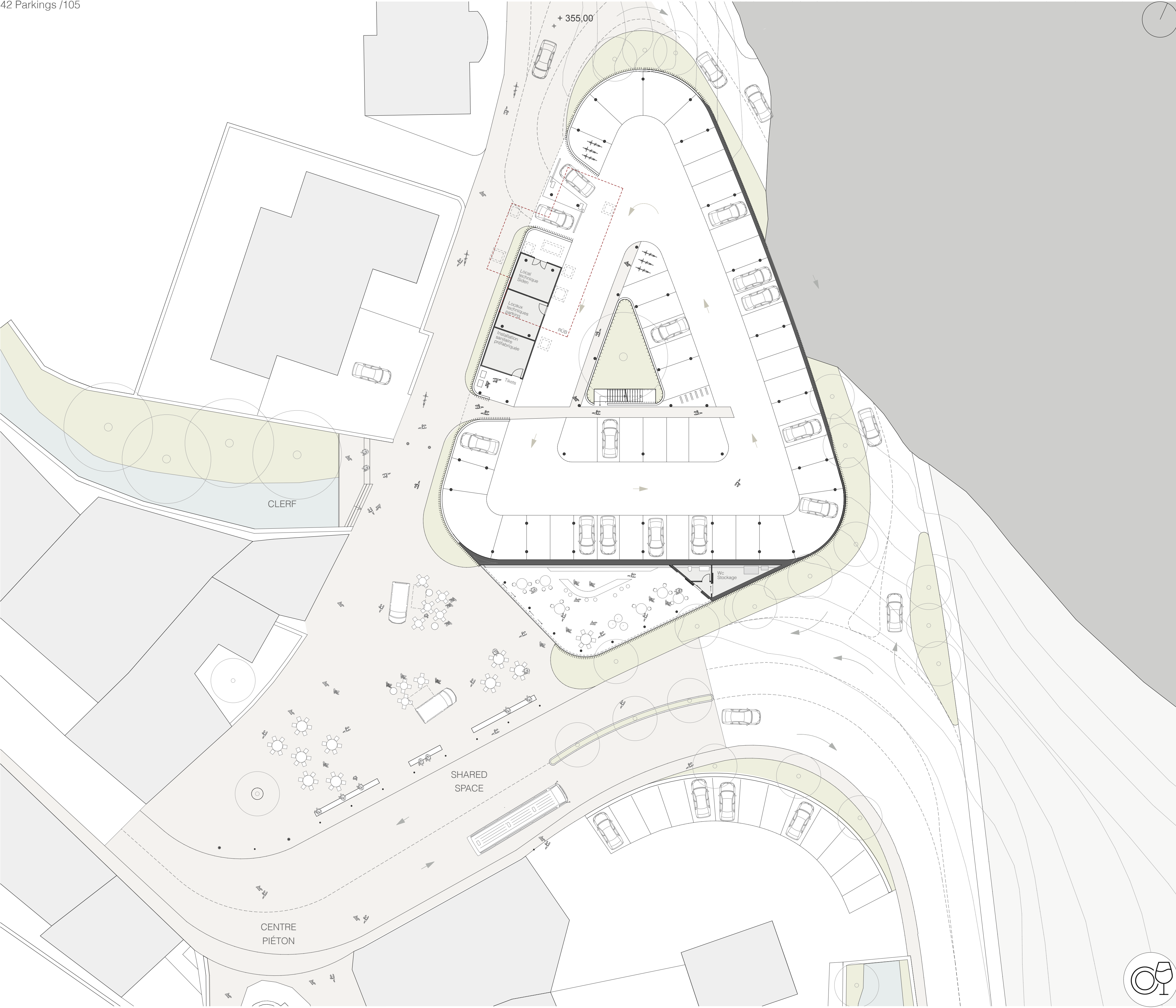
QUIOSQUE - INFO POINT