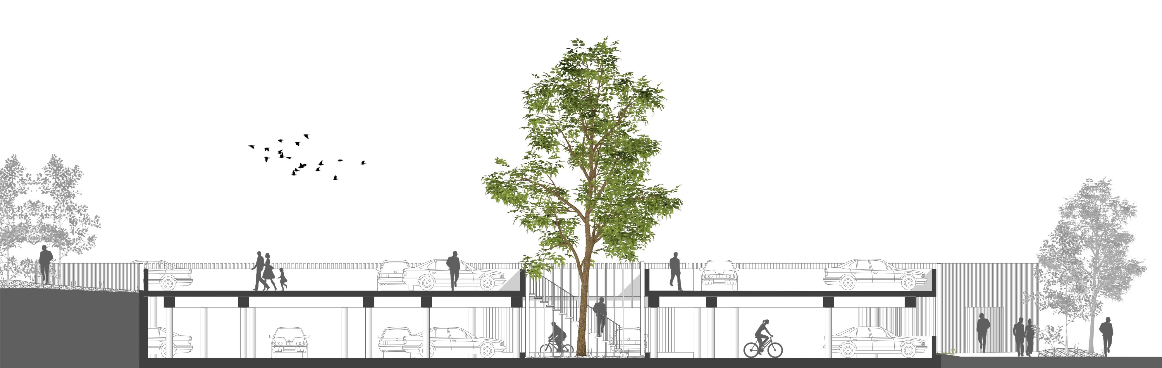
Coupe transversale - échelle 1:100