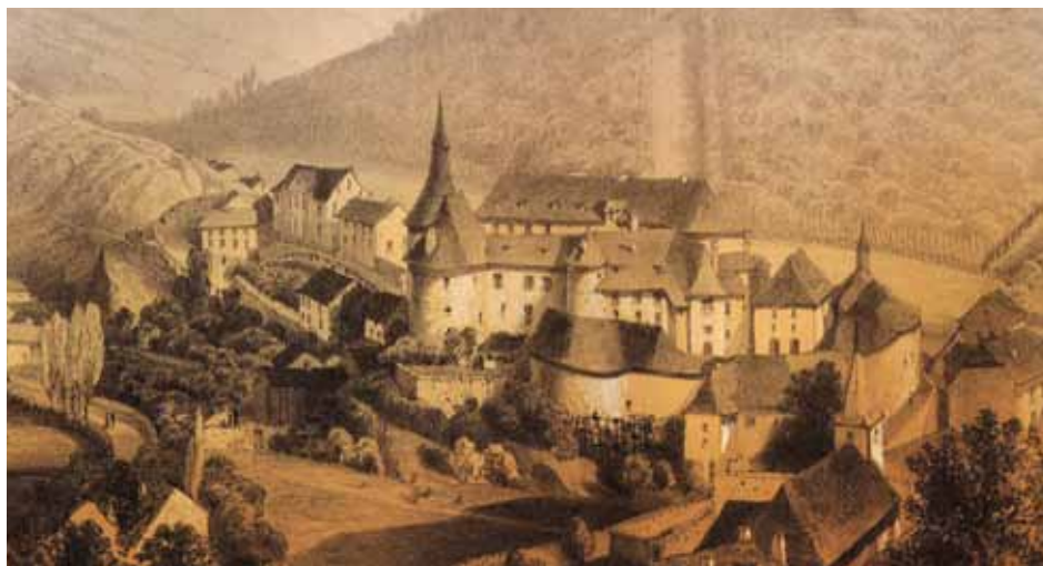
Clervaux, Album Pittoresque du Grand-Duché de Luxembourg, planche n°15, J.-B. Fresez, 1857

nettement cédé le pas à la fonction de siège seigneurial. Quelques tours médiévales (début du XV ème siècle) - notamment la Tour de Brandebourg, la tour de Bourgogne, la Tour du Colombier et la Tour des Sorcières - ponctuent agréablement l'enveloppe de bâtiments agencés autour d'une cour intérieure. La « baille » (cour d'entrée, où se trouvaient les écuries et les communs) ne présente plus d'enceinte de protection. Celle-ci fut partiellement détruite en 1885 pour servir de matériel de construction à la villa Berlaymont dans le parc.