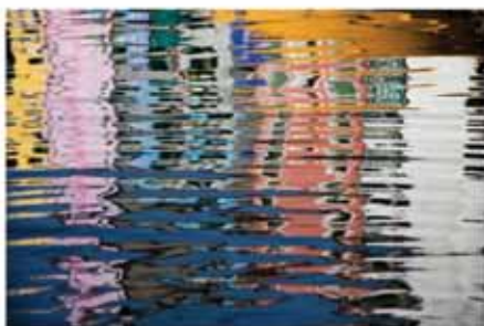
I Wanted To See The World © Jessica Backhaus

Arcades I, Grand-rue 1.10.2015 - 30.09.2016