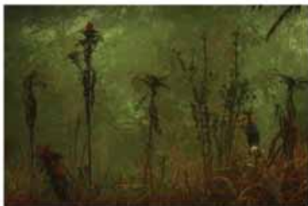
Where Gods Reside © Tine Poppe