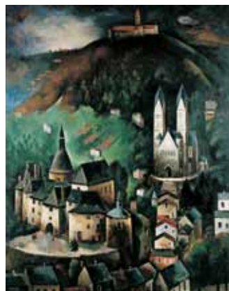
Joseph KUTTER (1894-1941): Clervaux, 1936-37

Für weitere Informationen, besuchen Sie die Internetseite www.mnha.lu