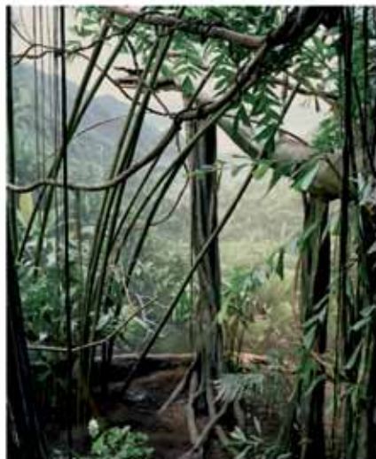
You are here # 8 © Sonja Braas